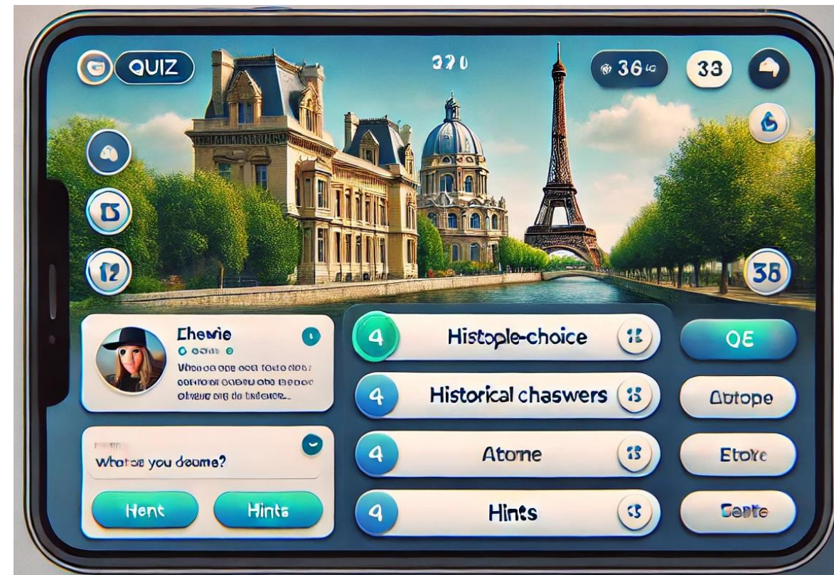
Imagen generada con ChatGPT

Mostrar un chat para interactuar y pedir pistas